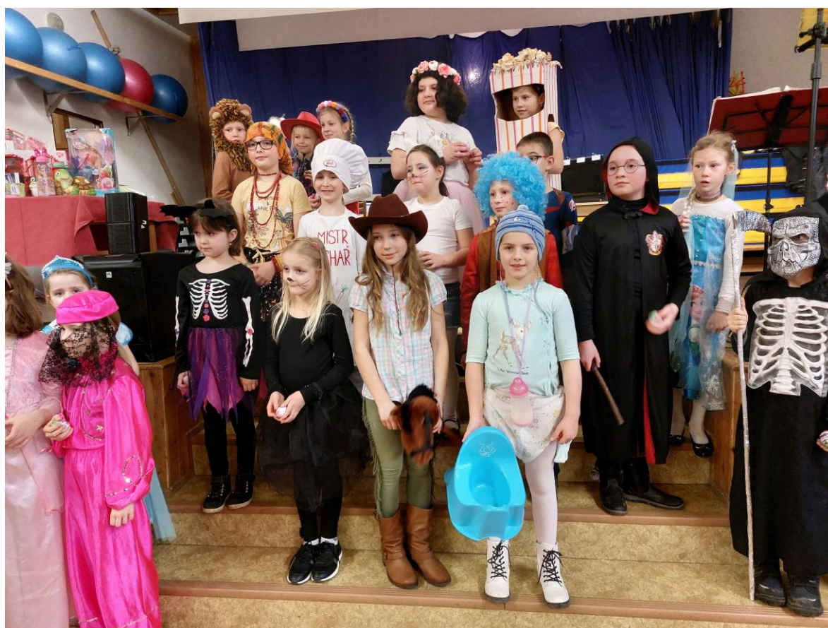
Dětský karneval 18.2.2023