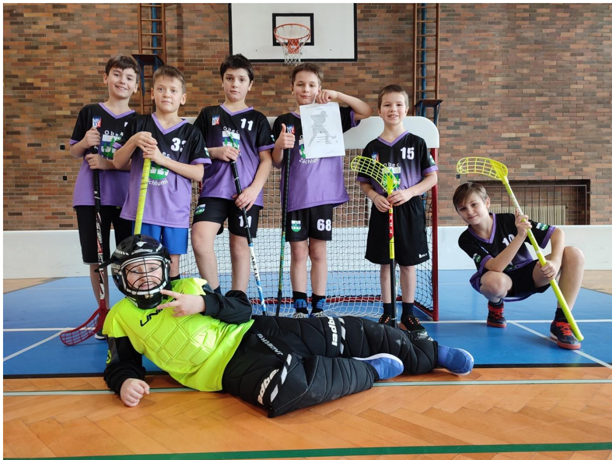
Skvělý tým našich kluků (borců) na florbalovém okrskovém kole 2023.