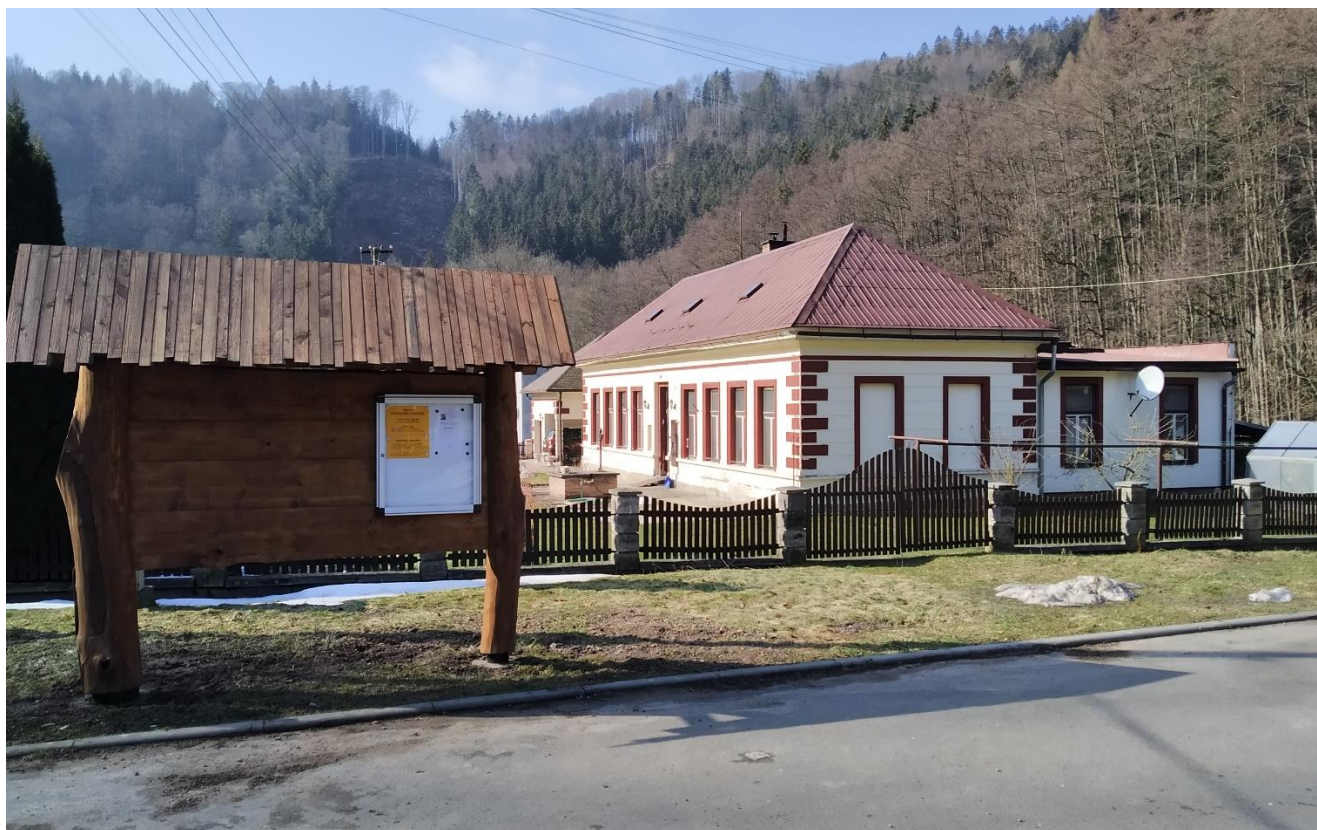
Nová vývěska v Liticích nad Orlicí u knihovny, foto 1. 3. 2021