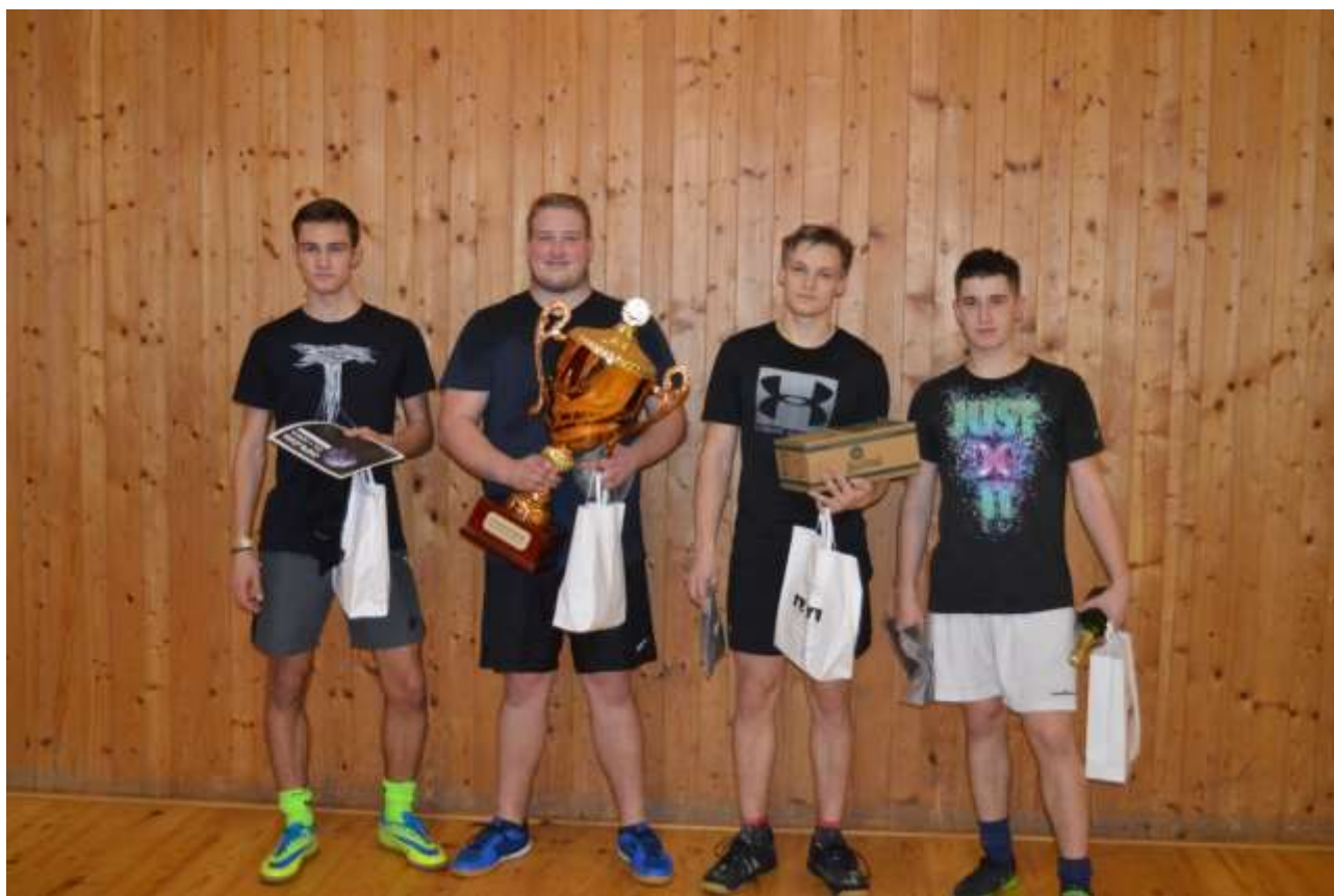
Záchlumí 12. 1. 2019 vítězné družstvo florbalového turnaje