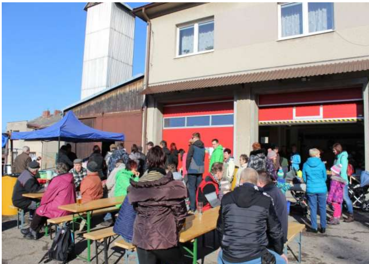
O nejlepší pálenku v okolí 2019, 16. 2. 2019