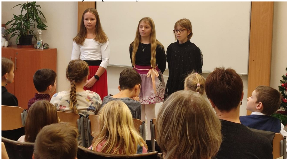
Recitační soutěž „Nebojte se klasiků 2023“ – skupina dívek

Další divadelní akcí byla návštěva Divišova divadla v Žamberku, kde v pondělí 4. prosince měli Vánoční koncert děti a žáci ze ZUŠ Žamberk. Všichni účinkující předvedli na své hudební nástroje to nejlepší, co umí a tak jsme mohli vidět velice povedené a atraktivní vystoupení různých hudebních oborů ale i tanečního oboru.