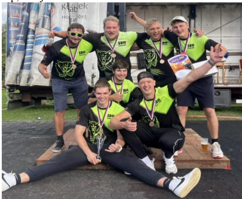
Mistři Okresní ligy Svitavska Mistři Velké ceny Ústeckoorlicka Vítězové Superpoháru hejtmána Pardubického kraje