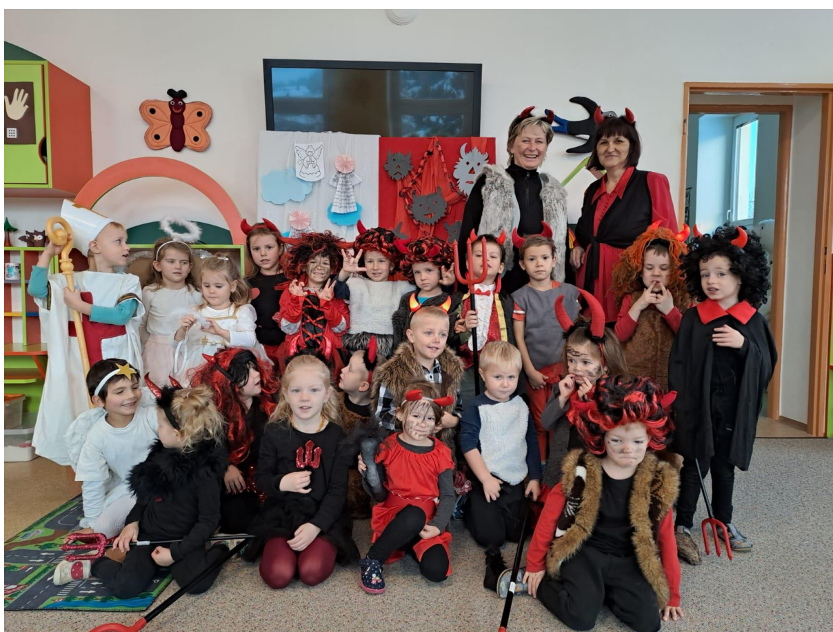
čertovské hrátky 2023