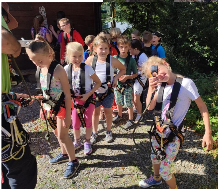
Lanový park na Dolní Moravě si užili hlavně Ti nejmenší