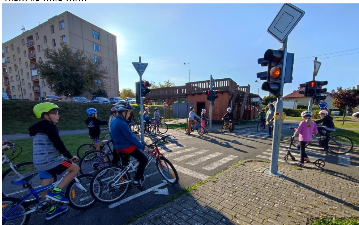
Dopravní hřiště v Žamberku – výukový program ANIMO