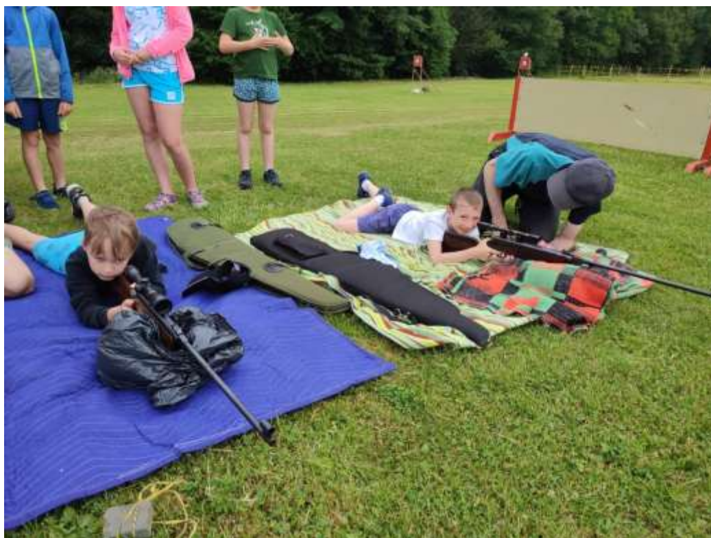
Střelba z malorážky na akci s mysliveckým spolkem