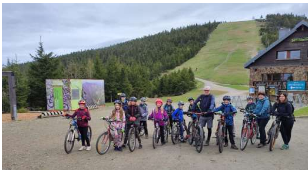
Cyklovýlet po hřebeni na Dolní Moravě.