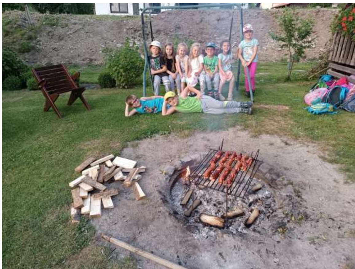
Tradiční loučení předškoláků se školkou, buřtíky nemohou chybět 😊