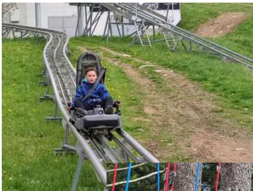
Mamutí horská dráha